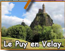
Le Puy en Velay

un parcours qui rejoint l'Adriatique à la Manche et qui unit les Pouilles à la Normandie, un voyage dans l'histoire de l'Europe tourné vers son avenir, un trajet sur l'un des plus anciens pèlerinages de l'Europe chrétienne, une marche vers le Christ sous la conduite de saint Michel archange, une expérience d'abandon et d'accueil, un pèlerinage vers des horizons intérieurs, une rencontre de milliers de visages nouveaux et différents, une aventure toujours en acte.