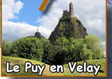
Le Puy en Velay