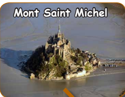
Mont Saint Michel