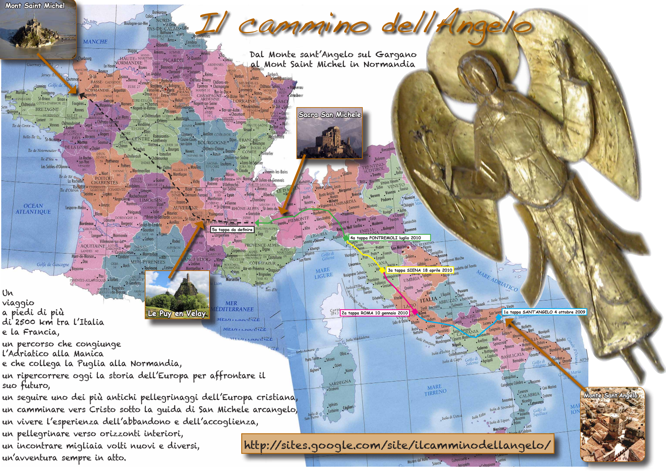
Saera San Michele

Dal Monte sant'Angelo sul Gargano al Mont Saint Michel in Normandia